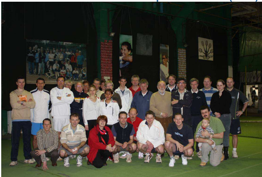
Barcelona 2008 – Cérémonie d'ouverture 4 championnat du monde ITFR

L'ITFR est une amicale qui regroupe des Rotariens désireux de promouvoir le tennis afin de développer des liens d'amitiés entre les membres du Rotary.